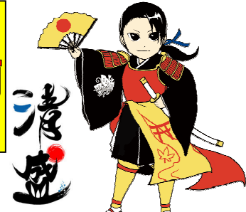
ひろしま清盛 (大河ドラマ「平清盛」広島県推進協議会キャラクター)

期間：2012年4月1日(日)～2013年1月14日(月・祝)の土・日・祝祭日限定